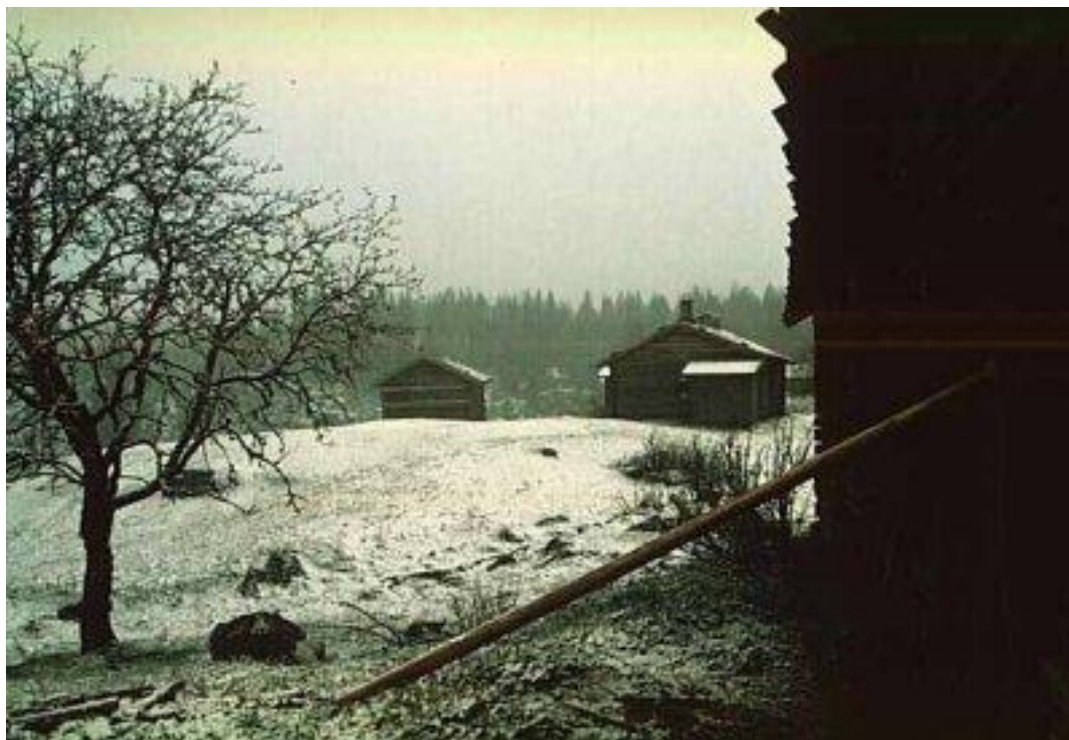
Ritamäki i snöoväder

Guiden, som hade tagit sig hit enkom för vår skull, tog emot oss i stugan. Ritamäki, ett byggnadsminne av riksintresse, är av den ålderdomliga och genuina varianten av finngård. Så här bodde de vanliga människorna i trakten förr. Boningshuset består enbart av en stor rökstuga och en liten kåve med spis av vanlig modell.