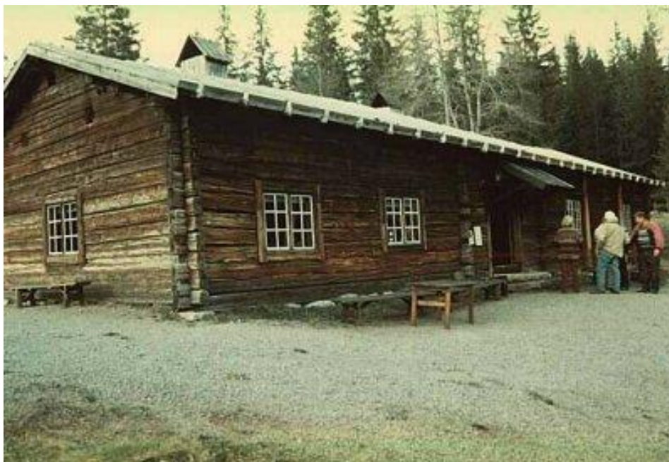
Rökstugan på Karmenkynna

Klockan började närma sig halv fem, och det var tid att vända bilarna mot Lekvattnets hembygdsgård Karmenkynna. Här skulle middagen avnjutas. På sommaren hålls gården öppen för turister, och då serveras motti med fläsk. Passande blev det motti även för oss. Det är alltid lika gott tycker jag. Rökstugan på Karmenkynna flyttades till platsen 1923. Den har senare tillbyggts med en svenskstuga. På anläggningen finns ett sjuttontal byggnader, särpräglade för trakten, tillkomna genom påverkan österifrån.